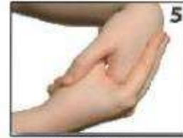
उँगुठे व हथेली को रगड़ना