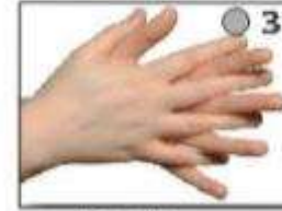
उँगलियों के बीच रगड़ना