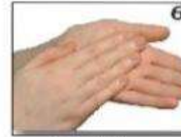
नाखूनों को हथेलियों पर रगड़ना