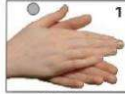
हथेलियों को रगड़ना