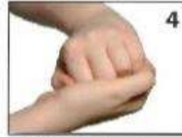
उँगलियों के आगे के भाग को रगड़ना