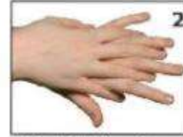
हथेलियों के पीछे के भाग को रगड़ना