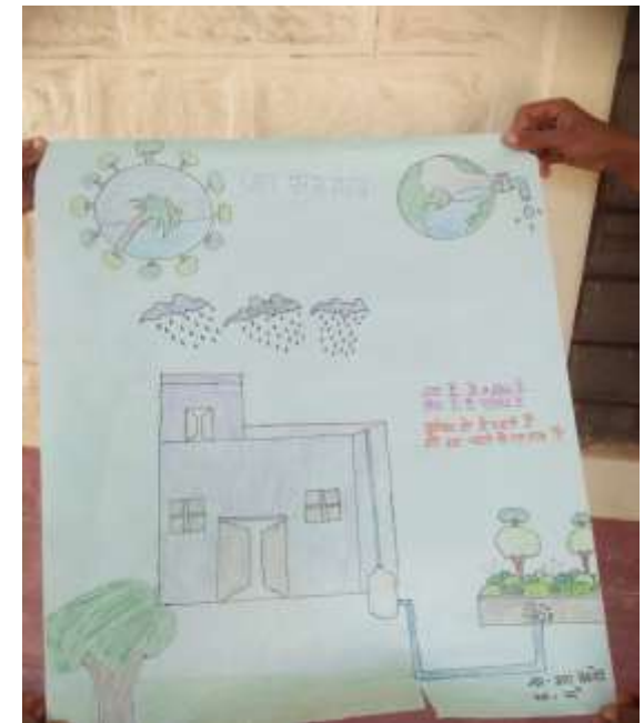
बच्चो द्वारा बनाये पोस्टर